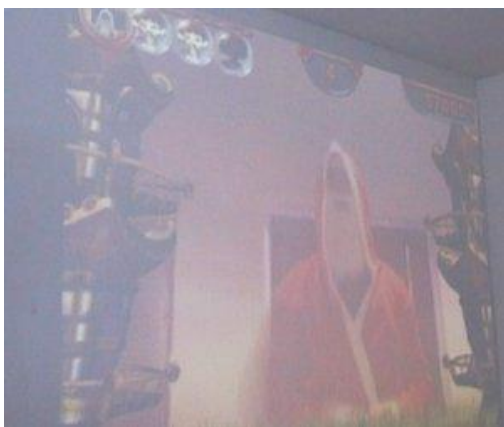
Sogar der Weihnachtsmann versuchte sich bei Eyetoy.